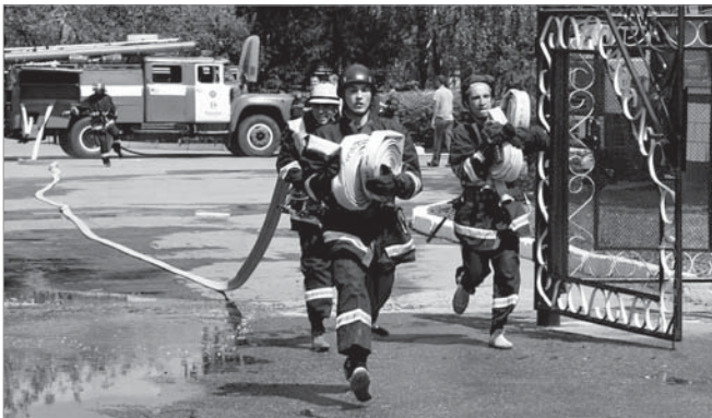
Вогнеборці під час виконання третьої вправи