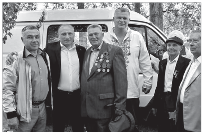
Депутати-азотівці та міський голова з ветеранами