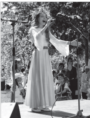
Щира пісня для ветеранів

Свято зібрало близько 1,5 тисячі черкащан різних поколінь, серед них ветерани війни, їхні діти, онуки й правнуки. З Днем Перемоги їх привітали керівники ПАТ «АЗОТ». До заходу долучилися й представники міської влади.