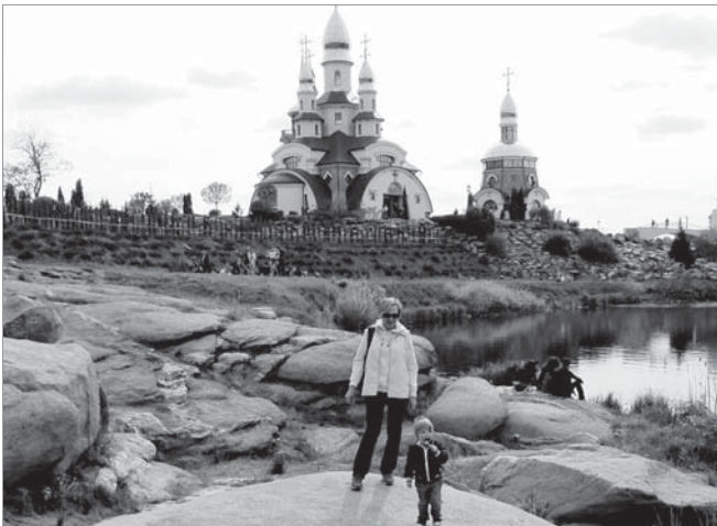
На території храмово-паркового комплексу в Буках

чі: сім'я Терешенків, мер міста Іван Толлі, Михайло Булгаков, родичка письменника Льва Толстого та царські особи. Кілька десятиліть поспіль у «зеленому корпусі» збираються «гуру» шахів і доміно.