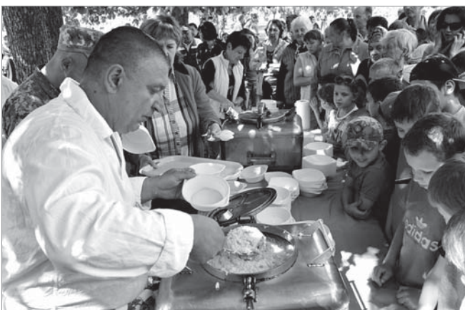
Солдатської каші змогли скуштувати всі охочі