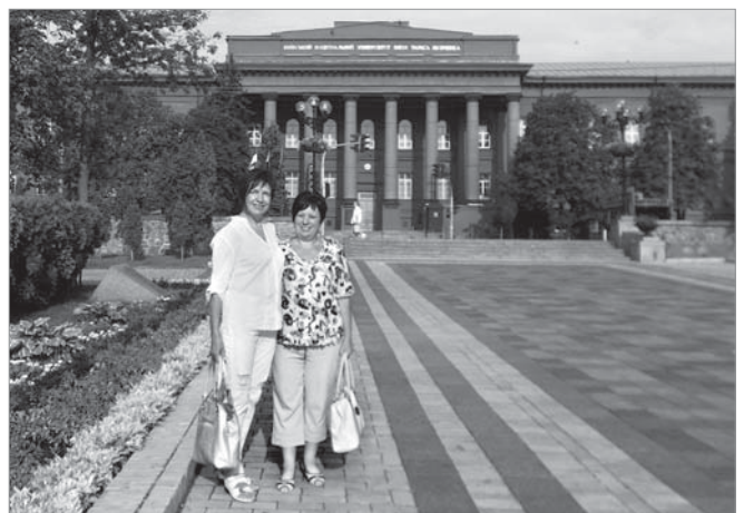
У парку імені Тараса Шевченка в Києві

Якщо ви встигли побачити чимало красивих місцин України і прагнете ще чогось несподіваного – відвідайте Буки. Не пожалкуєте.