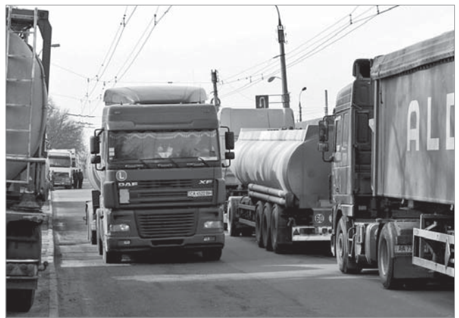
Загалом, у першому кварталі 2016 року ПАТ «АЗОТ» OSTCHEM відвантажив на внутрішній ринок понад 547 тисяч тонн мінеральних добрив.