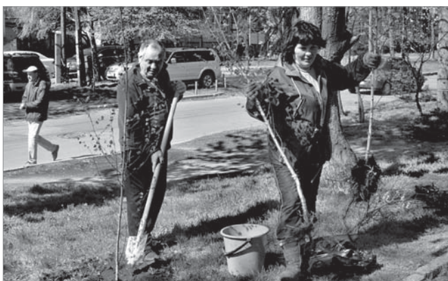
Активісти займаються висадкою берізок