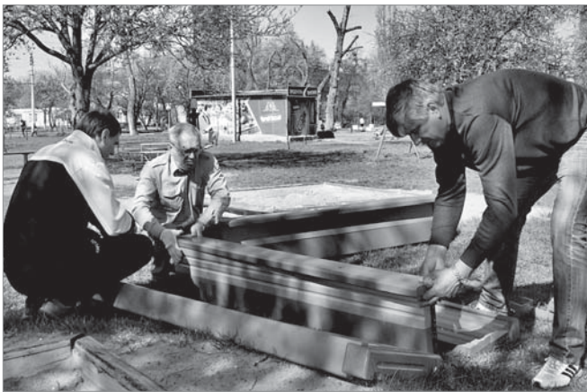
Встановлення пісочниць біля будинку по вул. Горького, 23

Протягом квітня працівники Черкаського «Азоту», що входить до холдингу OSTCHEM (об'єднує підприємства азотної хімії Group DF), працювали над благоустроєм вулиць, житлових дворів, територій навчальних закладів міста, долучаючись до всіх екологічних акцій, що проходили цього місяця.