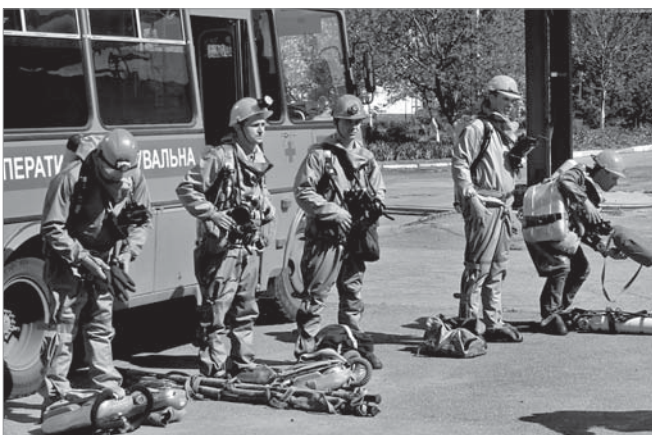
На місце «надзвичайної» ситуації прибули газорятувальники