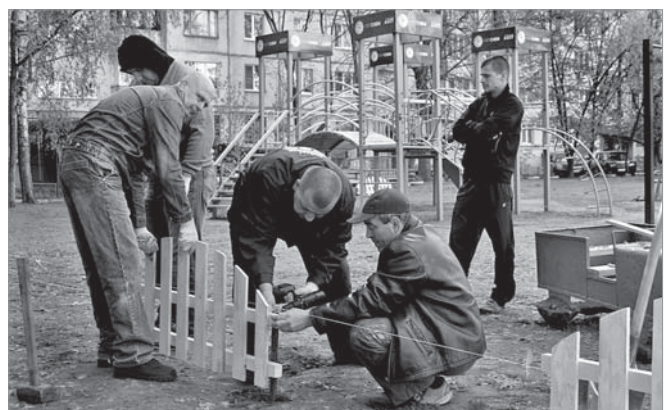
Працівники «Азоту» встановлюють парканчик (вул. Гоголя, 440)