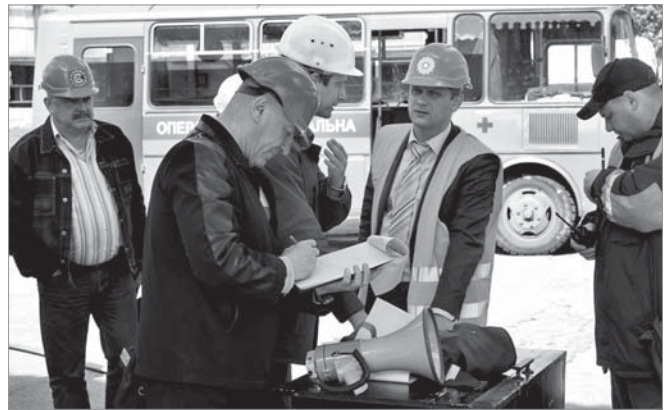
Штаб з «ліквідації» аварії в цеху К-5

Також підбито підсумки огляду-конкурсу на кращу організацію роботи з охорони праці і пожежної безпеки в першому кварталі. Переможцями серед основних цехів визнано: А-3, М-7 та ОПСВ, які посіли відповідно перше, друге і третє місця. Серед допоміжних структурних підрозділів перше місце дісталось ЦВТК, друге – централізованому електро-