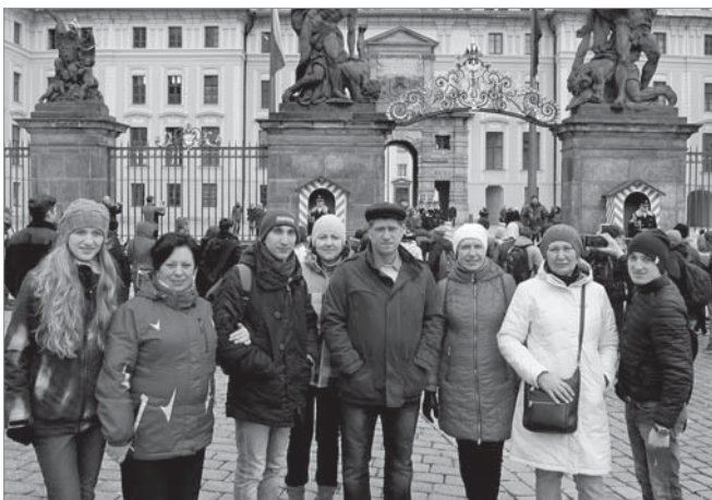
Перед парадним входом у Празький Град

Згідно з Книгою рекордів Гіннеса, Празький Град, довжиною 570 метрів і шириною майже 130 метрів, є найбільшим суцільним замковим комплексом у світі. Його площа майже 70 000 м 2 . Занесений до списку Всесвітньої спадщини ЮНЕСКО, він складається з великої композиції палаців і церковних будівель різних архітектурних стилів, від будівель римського стилю Х століття до готичних церков та палаців XIV століття.