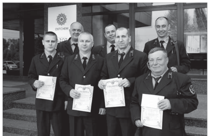
Відділення №3 ВГРЗ – переможець внутрішніх змагань