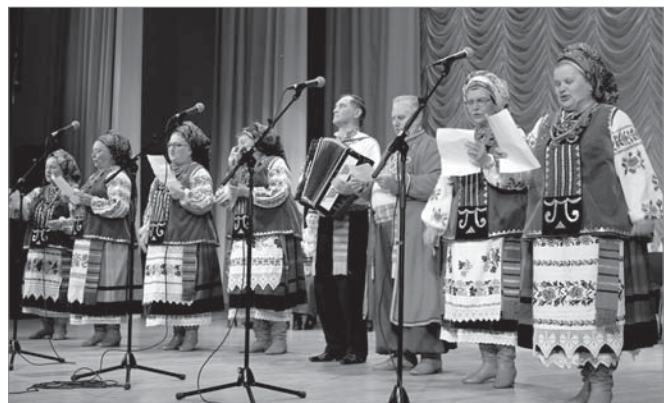
Ширі вітання від фольклорного ансамблю «Спадщина»