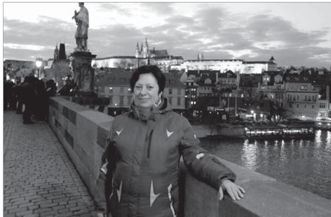
На Карловому мосту

Стара Прага розкинулася по обидва боки річки Влтава. Перш ніж місто стало «Златою Прагою», пройшло багато століть. Вчені встановили, що вже близько 850 року існував цей край, як торговий і культурний центр. Для його захисту від нападів було побудовано дві фортеці – Вишеград і Празький Град. Про Вишеград уже йшла мова, на черзі – Празький Град , що розкинувся на лівому березі річки. Його справедливо вважають історичним серцем столиці та предметом гордості. Можна сказати, що це місто в місті, обнесене фортечною сті-