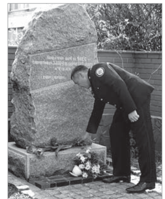
Покладання квітів до меморіалу

На знак 30-ї річниці трагедії на ЧАЕС на фасаді частини була закладена «Капсула часу», в яку помістили всю інформацію станом на квітень 2016 року з такими відомостями: список керівництва держави, ДСНС України, ДСНС України у Черкаській області, керівництва ПАТ «АЗОТ», 1 ДПРЗ Управління ДСНС України у Черкаській області та підпо-