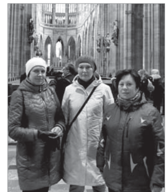
Велич Собору Святого Віта

готичному стилі з елементами бароко, він приголомшує своєю пишністю. Прикрашений безліччю скульптур різних розмірів, кожна з яких має свій зміст. Здається, що жакливі гаргулії, стрибнуть з висоти прямо на вас... Зовні Собор прикрашений унікальними башточками, орнаментами, кам'яними й бронзовими барельєфами. Тут завжди багатолюдно. Сюди приходять помилуватися красою, якій невідвладний час. Велич Собору Святого Віта така, що на його фоні почуваш себе маленькою мурахою.