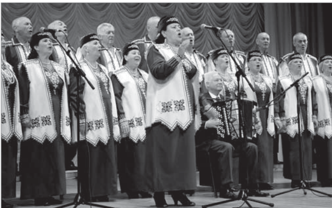
Співає народний аматорський хор ветеранів «Азоту»

27 квітня у ПК «Дружба народів» відбувся ювілейний звітний концерт народного аматорського колективу профспілок України – хору ветеранів Черкаського «Азоту», який 15 років поспіль перебуває в полоні пісенного мистецтва. В репертуарі хористів близько ста пісень. Є навіть такі самобутні твори, які не виконує жоден творчий колектив Черкащини.