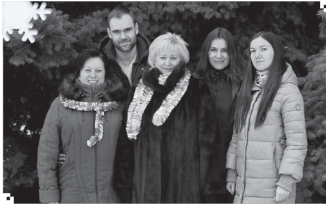
Колектив Прес-центру ПАТ «АЗОТ»

Постійний зворотний зв'язок із читачами, а це переважно наші виробничники,