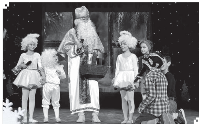
Традиційне казкове дійство на сцені ПК «Дружба народів»