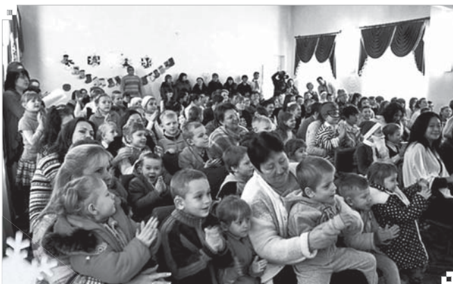
Праздничный концерт в школе-интернате №6