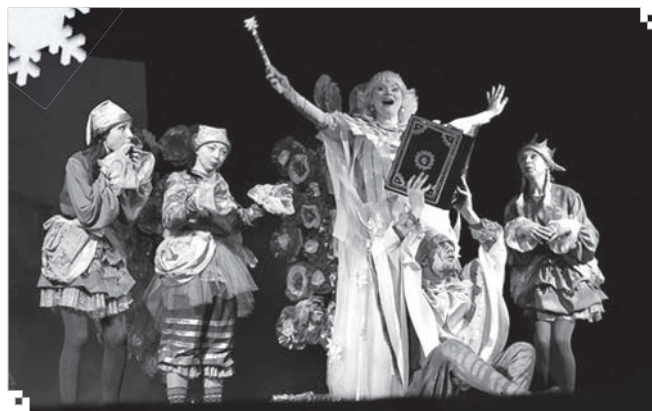
Постановка сказки «Волшебник изумрудного города»