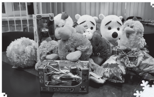
Іграшки та подарунки для дітей від профспілкового комітету