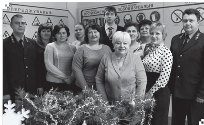
Колектив відділу охорони праці та ВГРЗ

Напередодні Нового року працівники служби охорони праці привітали виробничників «Азоту» зі святом. Побажали всім міцного здоров'я, затишку і добробуту в родинях, щоб всі проблеми та негаразди залишилися в минулому році, а Новий 2017 рік став роком стабільної плідної роботи на благо рідного підприємства та України.