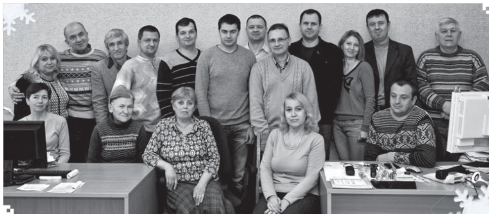
Колектив відділу головного метролога