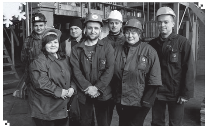
Зміна №2 відділення упаковки і складу цеху М-9