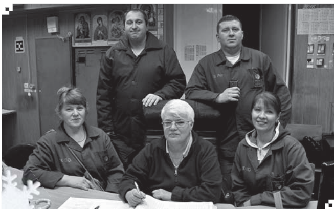
Зміна №1 цеху М-9 на ЦПУ гранбашти