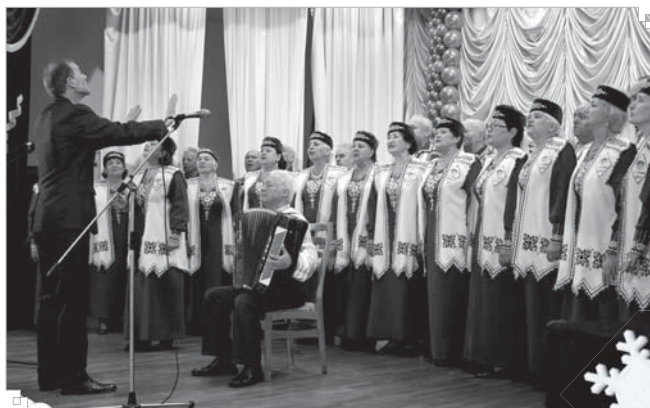
Виступ хору ветеранів праці ПАТ «АЗОТ»